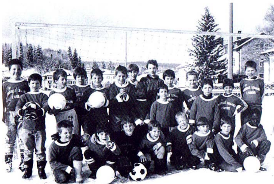
Entraînement hors saison de nos «espoirs».