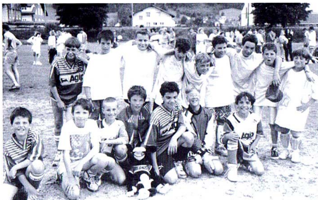
FC Vallée de Joux: 132 équipes ont disputé le tournoi à six du 75 e anniversaire, au Sentier les 19 et 20 juin 1993.