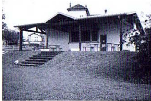
Buvette de notre terrain aux Charbonnières

comme vestiaire fut construite en 1934. Plusieurs améliorations furent apportées au terrain tout au long des années. Et après l'accès pour la première fois en 2 e ligue de notre première équipe, une commission a étudié l'emplacement et la réalisation d'un nouveau terrain de sports. Des travaux sont entrepris en 1948 et l'inauguration a lieu le 21 août 1949. Pendant ces travaux, nos équipes se sont entraînées et ont disputé leurs matches sur l'emplacement actuel du Centre sportif, ceci avant la correction de l'Orbe, et à la suite d'inondations ont pu disposer de la place de gymnastique. Les membres du club se sont souvent mobilisés pour que ces installations provisoires remplissent les conditions nécessaires à la pratique du football. Pour compléter le nouveau terrain, une construction en dur fut réalisée en 1951. Elle comprenait deux vestiaires, un local de douches et des toilettes.