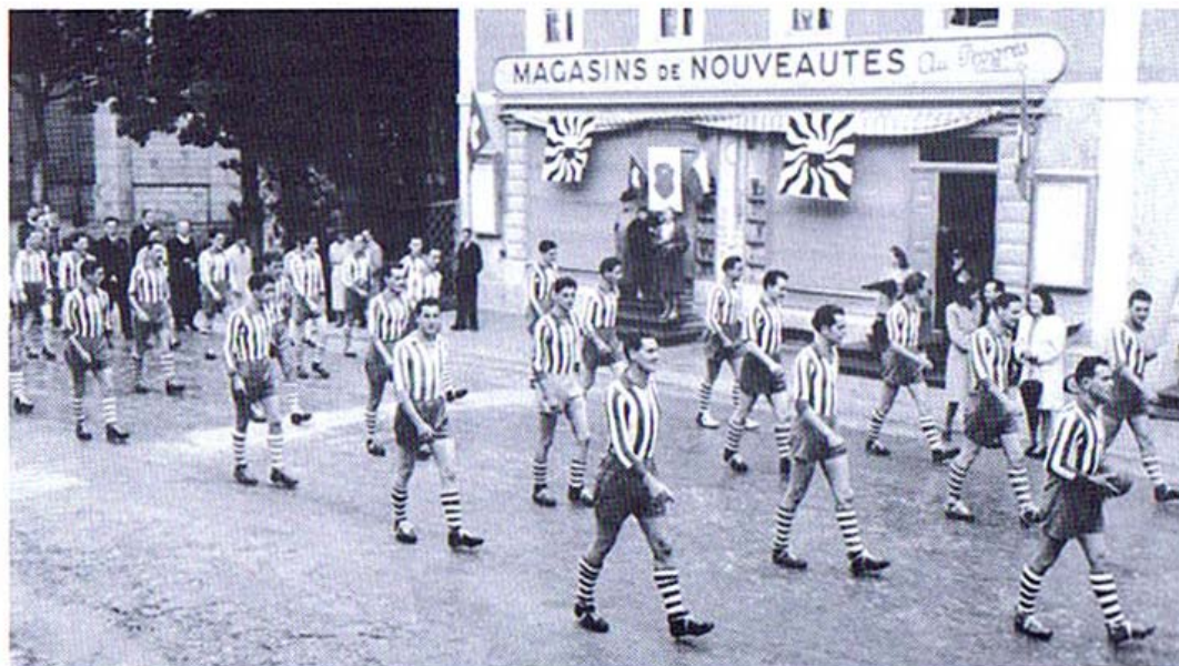
Première apparition publique pour les footballeurs au Sentier

Le 24 août 1946, c'est la commémoration du 300 e anniversaire de la commune du Chenit. Pour la première fois, le F.C.Sentier en tenue bleu et blanc, souliers à crampons, participe à un cortège officiel.