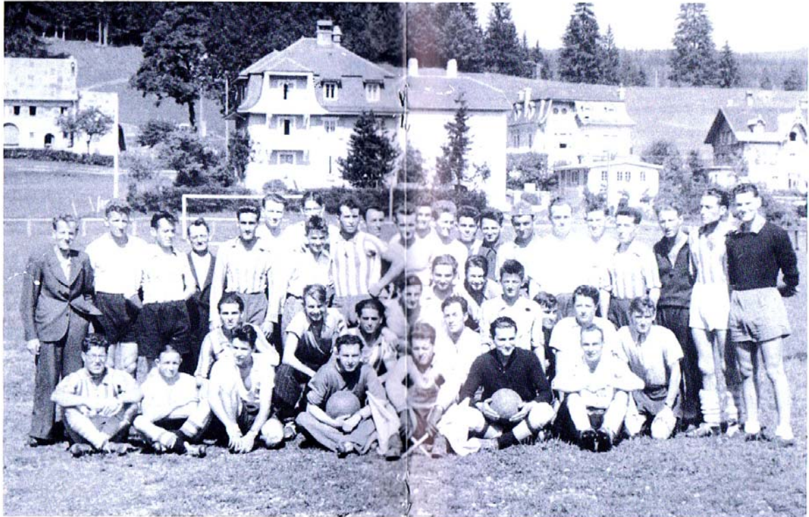
Les 25 ans du club en 1943